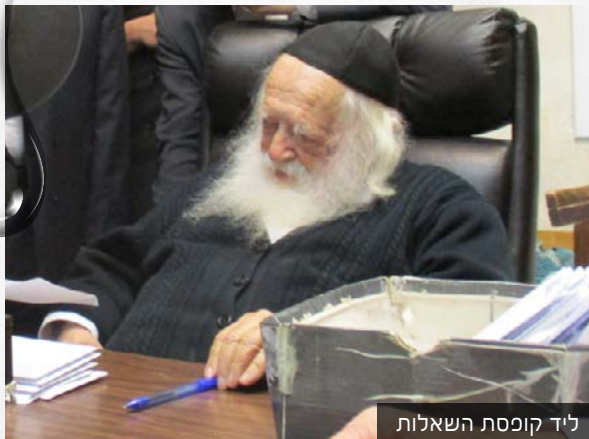
ליד קופסת השאלות