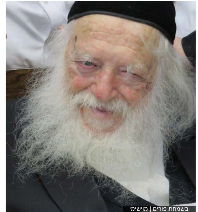
בשמחת פורים | מוישימי

אולם הסכיתו לקטע הבא מדברי חז"ל: "אמר הכתוב, (תהילים ק"ו) אֲנָרִי שְׁמִרִי מְשֹׁפֵט, עֲשֵׂה צְדָקָה בְּכָל עֵת. וכי אפשר לו לאדם לעשות צדקה בכל עת? רבותינו שביבנה אמרו, שהכוונה היא לאותו שזן