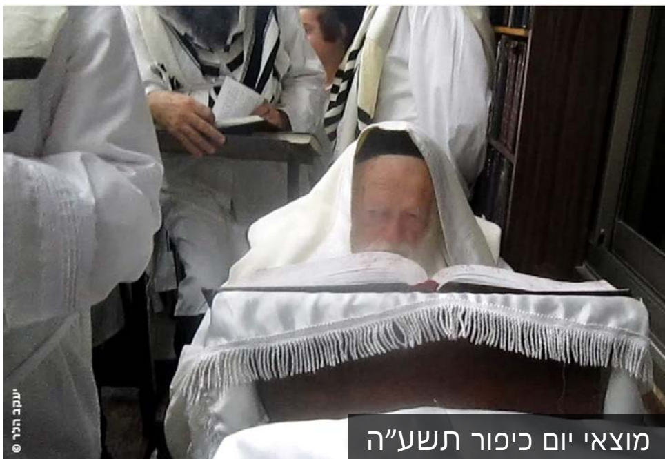
מוצאי יום כיפור תשע"ה