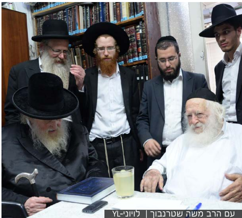
עם הרב משה שטרנבוך | ליוני-21

תנחומא פרשת שמות: "ואוהבו שחרו מוסר, זו בת שבע הצדקת. שיסרה את שלמה בנה, ומה היתה אומרת לו? בני, הכל יודעין שאביך ירא שמים, עכשיו אם תצא לתרבות רעה יאמרו שאתה בני ואני גרמתי לך. כל נשי אביך היו נודרות ואומרות: יהא לי בן הגון למלכות. ואני נדרתי יהא לי בן חכם ממולא בתורה והגון לנביאות!