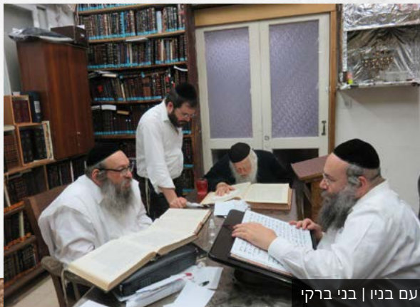
עם בניו | בני ברקי

לבקשות ברכה ועצה. אבי שיחי' היה כותב את הבקשה או השאלה ואני זכיתי להיות השליחה!