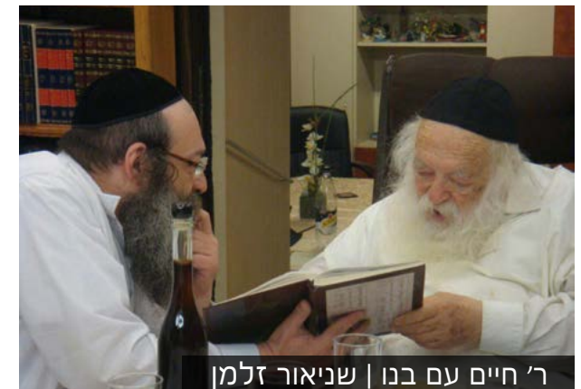
ר' חיים עם בנו | שניאור זלמן

לי אותה. וגם את ה'ראשית חכמה' שמביא את המאמר בשער היראה פרק י"ב. בזמן שהרב מבריסק שהה בבני ברק בשנת תש"ט בישיבת 'תפארת ציון', ביקש החזו"א מכמה בחורים שיתפללו עם מרן הגרי"ז זצ"ל. ולאחר זמן אמרו הבחורים לחזו"א שהם לא הלכו, כיוון שהם רצו להתפלל ב'מנין ישיבתי'. אמר להם החזו"א: 'הלא תדעו כי הפסדתם מצוות עשה דאורייתא של 'לדבקה בו'...' וכשסיפרו זאת לרבי חיים זצ"ל הביא על אתר את דברי החתם סופר [בהגהות חת"ס על שו"ע או"ח סי' ק"ב] על דברי חנה לעלי בשמואל א' [א,כו] "וְתֹאמַר בִּי אֲדֹנָי חִי נִפְשֶׁךָ אֲדֹנָי אֲנִי הָאִשָּׁה הַנֹּצֵבֶת עִמָּךָ בְּזֶה לְהַתְּפַלֵּל אֶל ה'" שכוונתה הייתה להתפלל לידו, שסגולה נפלאה להתפלל לצד הצדיק.