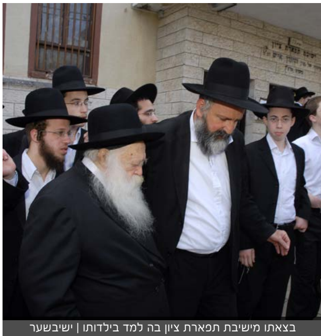
בצאתו משיבת תפארת ציון בה למד בילדותו