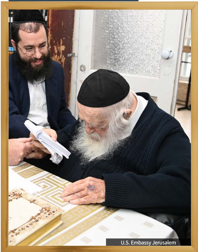
U.S. Embassy Jerusalem

הרבה סיפורים סופרו, עובדות והנהגות, ואם לא נעצור ונתמקד במשהו לקחת איתנו כדי להעצים את העולם הרוחני שלנו, לראות את העבודה הרוחנית שלנו כעצם החיים, להעצים את